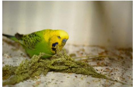
Gedroogd wordt het ook graag gegeten

Voor het drogen heb ik een speciale bak gemaakt met horregraas als bodem. Twee latjes aan de onderkant zorgen er voor dat het geheel een eindje van de grond staat. Hierdoor zijn de aartjes van de hanepoot in een mum van tijd droog en kunnen ze in de papieren zakken worden opgeslagen. Tijdens het drogen zijn er veel zaadjes uit de aren gevallen en deze kunnen apart aan de vogels worden gevoerd.