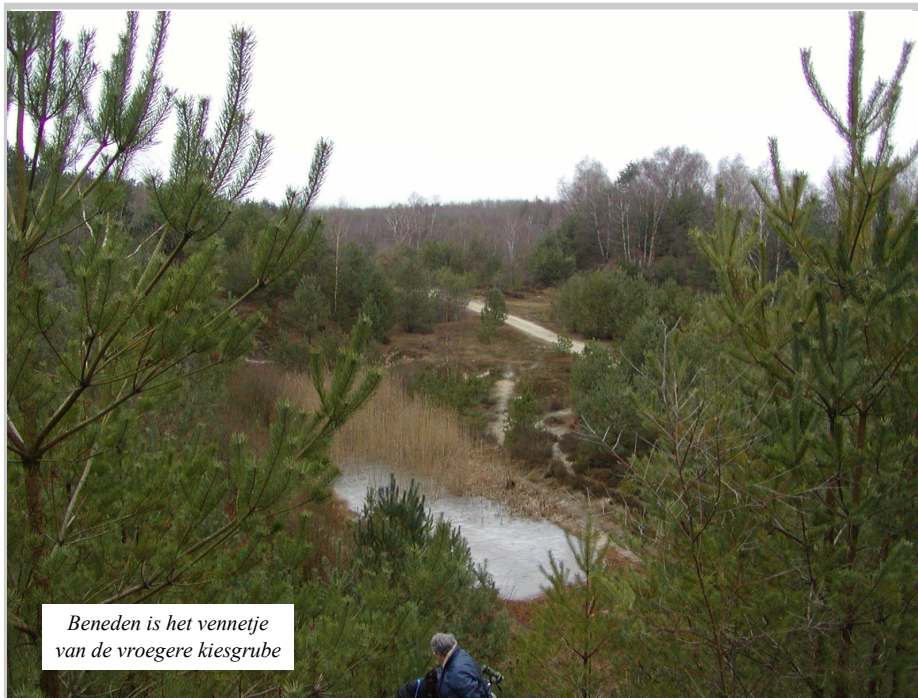
Beneden is het vennetje van de vroegere kiesgrube