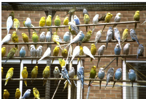
Vogels van Amos en Tumbwood

Deze kwekers hadden nog een grote voorraad grasparkieten in de volière rondvliegen. Er zaten opvallend veel witte zwartogen bij. Deze lijken veel op albino's, maar de mannen hebben een blauwe neusdop en de beide geslachten hebben zwarte ogen. In principe zijn dit doorgefokte spangle mutaties en dat was bij deze kwekers dus ook het geval. We hebben ons bij deze beide kwekers enige tijd op een prettige wijze opgehouden.