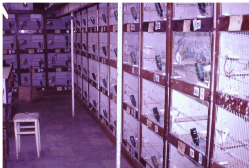
Broedkooien van Sigston