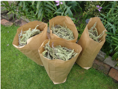
Gedroogd in papieren zakken opgeslagen

Het liefst voer ik de hanepoot in verse toestand, maar de groeitijd is maar zeer beperkt en beslaat enige weken in juli en augustus. Je moet de zelf geplukte onkruidzaden zien als een extraatje voor de vogels. Het is een nuttig bijproduct en je kunt ze er lekker mee verwennen.